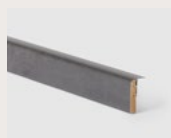
Dark Grey Stone